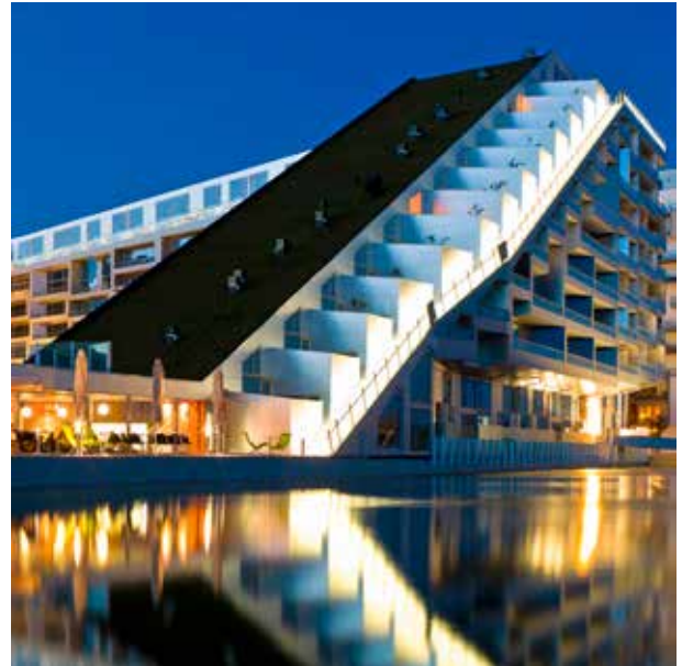
Fig 5. 8 HOUSE por BIG Copenhagen- Dinamarca

Hay muchas interrogantes que se pueden plantear al respecto. La intención de este repaso rápido de algunos conceptos sobre la vivienda a través del tiempo es solo motivar la búsqueda de respuestas después de la crisis. Como se puede apreciar, las soluciones tienen un común denominador: la preocupación del hombre gregario por buscar cobijo de las inclemencias, la mancomunidad y la seguridad es constante. Esto se ha observado en los conceptos de Charles Fourier o Andre Godin con los Familisterios en 1880 (figura 1) y con Bjarke Ingels en su proyecto 8 House, de uso mixto, de 60,000 m 2 , construido en Dinamarca en el año 2010 (Figura 2 y 5).