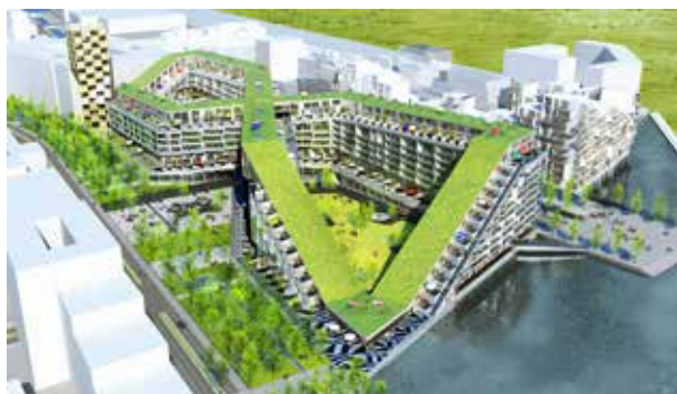
Figura 2. Complejo arquitectónico de uso mixto de 476 viviendas y comercio. Edificado entre los años 2006 y 2010. BIG Copenhagen - Dinamarca

ciudad compacta han decantado en la segunda, por el obvio ahorro de recursos de suelos, infraestructura y servicios. Quedaba claro que esa era la nueva tendencia.