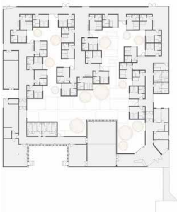
Figura 3. "ALDEAMAYOR" Residencia para mayores del Arq. Oscar Miguel Ares.