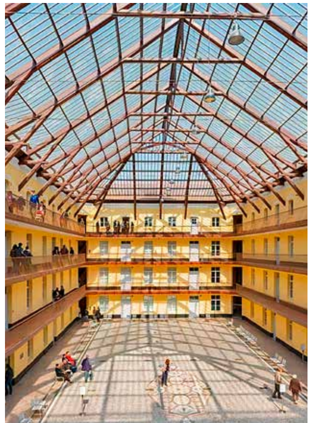
Fig 1b. Familisterio de Andres Goudin (1880)

Después de las guerras, conflictos sociales y pandemias, hemos heredado cambios y tendencias tanto en los conceptos urbanísticos como en las viviendas, unas que