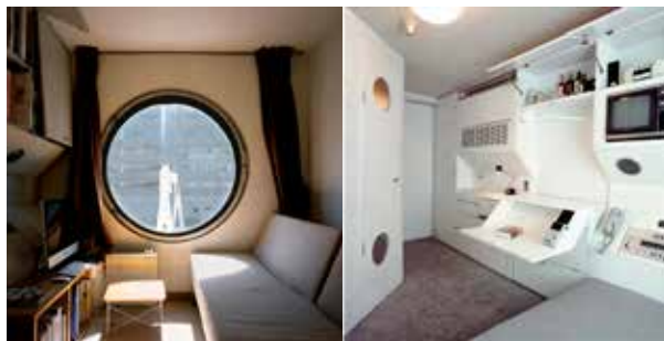
Figura 4. Torre Nakagin – Tokio 1972 y los interiores de los departamentos

cambios a través del tiempo. De esta manera, el dimensionamiento mínimo será el que requieran sus ocupantes.