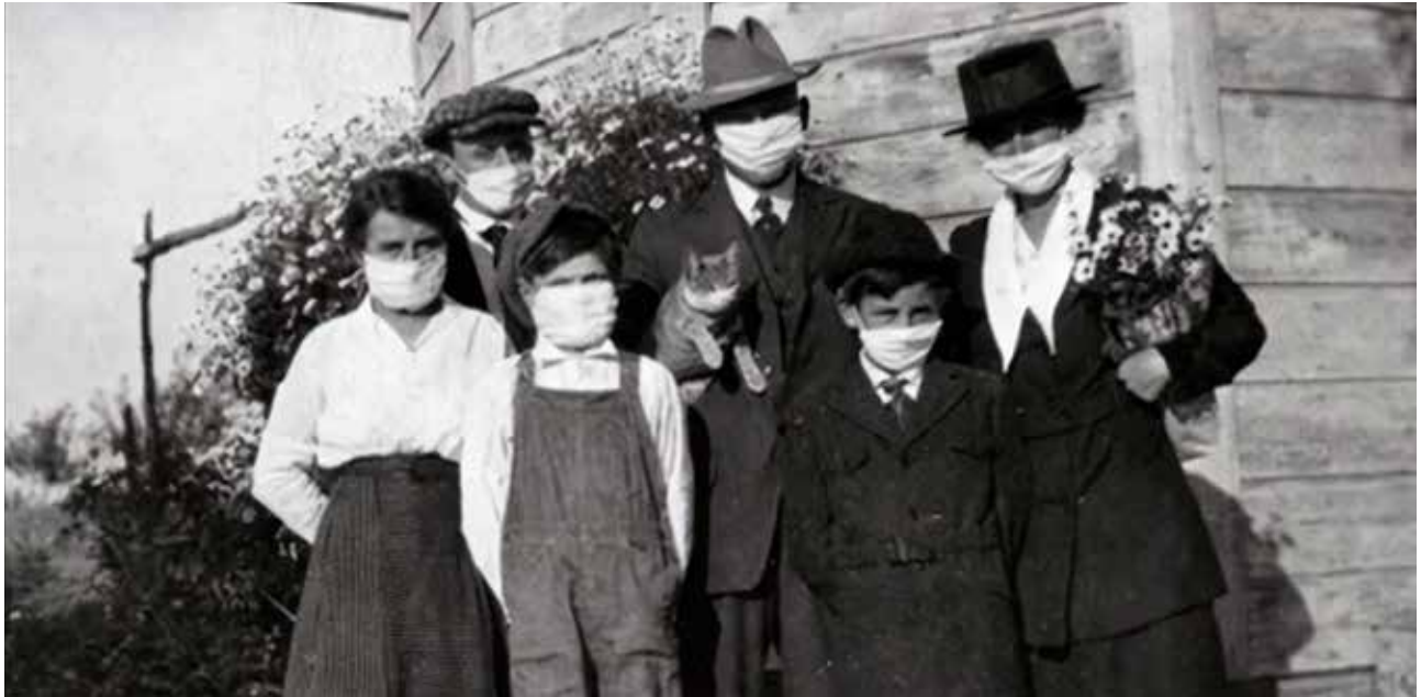
Familia californiana usando máscaras durante la gripe española